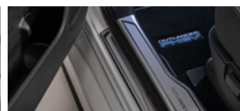
RVS instaplijsten portieren