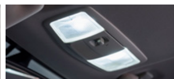
Led upgrade pakket